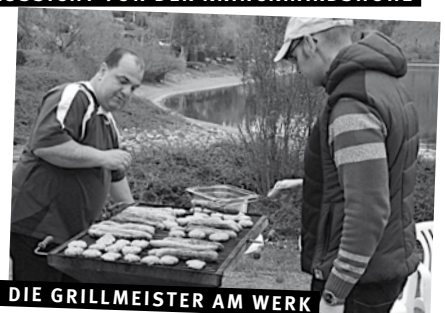
DIE GRILLMEISTER AM WERK