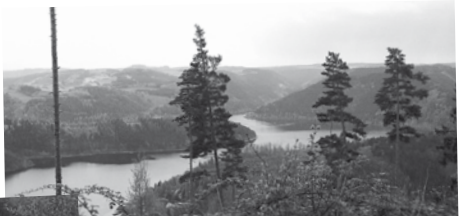
AUSSICHT VON DER KRINCKHARDSHÖHE