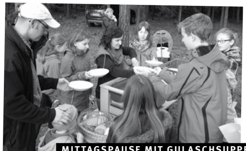
MITTAGSPAUSE MIT GULASCHSUPPE.

Wir danken allen Thüringern nochmals ganz herzlich für die wohlthuende Gastfreundschaft. Alle Teilnehmer waren für ein weiteres Familientreffen im kommenden Jahr. Dann voraussichtlich irgendwo auf halbem Weg. Wer Lust bekommen hat, mitzufahren, sollte sich das Wochenende vom 28. April bis 1. Mai 2018 frei halten. ■ Gisliind Fischer