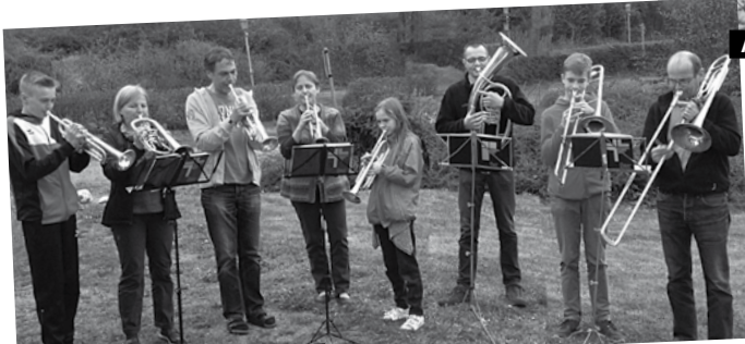
BEIM WECKRUF DEN TAG.