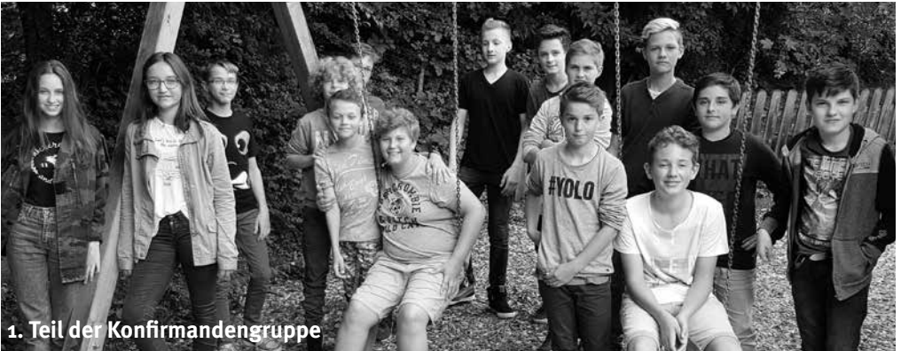
1. Teil der Konfirmandengruppe

Wie in den vergangenen Jahren laden wir wieder vor den Sommerferien zu einem Grillabend ein, nicht nur Mitarbeiterinnen und Mitarbeiter, sondern alle, die Interesse haben, auch Familien mit ihren Kindern. Er findet am Freitag, 22. Juli ab 18:30 Uhr im und ums Gemeindezentrum Neugreuth statt. Damit der Aufwand nicht zu groß wird, bringt jeder sein Geschirr und Besteck und was er auf den Grill legen will selber mit. Aus mitgebrachten Salaten, Nachtisch und Kuchen etc. stellen wir ein Buffet zusammen, an dem sich jeder bedienen darf. Getränke sind vorhanden. Das Programm an diesem Abend: Zeit haben, zusammen essen und miteinander ins Gespräch kommen. ■ Pfr. D. Schott