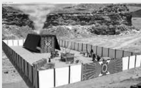
Das Heiligtum Gottes in der Wüste - Hintergründe und Bedeutung der Stiftshütte siehe: wachsen-im-glauben.de