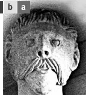
Foto: Schickhardt im Esslinger Rathaus